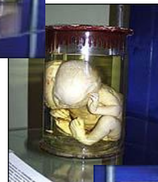
Ужасные экспонаты Кунсткамеры