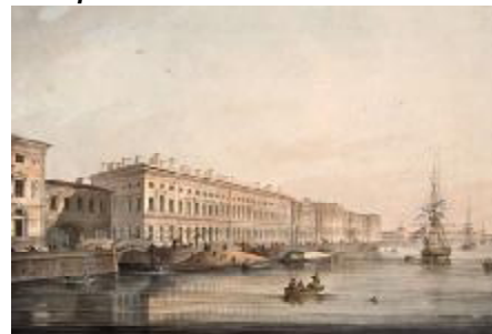
Дворцовая набережная (1826 г.)