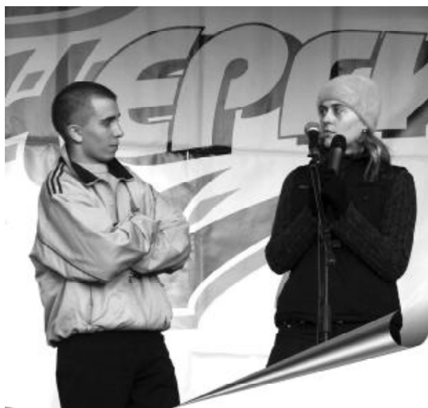
Мы представляем нашу газету

«Орел» не оставил никаких сомнений – и мы отправились на сцену. Надо сказать, что выступили не все, а из тех, кто вышел, трудно отметить кого-то яркого. Сценки, в которых участвовало далеко не два человека, представляли собой смесь чего-то музыкального и стихотворного. Мы же без музыки, чуть-чуть запинаясь, представили свою визитку в остроумной форме, за что и получили почетное третье место! Второе – у Томска («Твоя студенческая газета», ТПУ), а первое не досталось никому. Вот так в первый день мы, единственные выступавшие