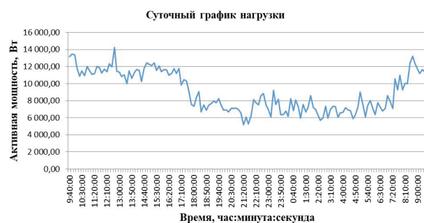
Рис. 4. График детализирующих компонентов прогнозируемой нагрузки

Измерения активной мощности проводилось с интервалом в 10 минут в течение суток. В данном случае рассматривается краткосрочный прогноз электропотребления.