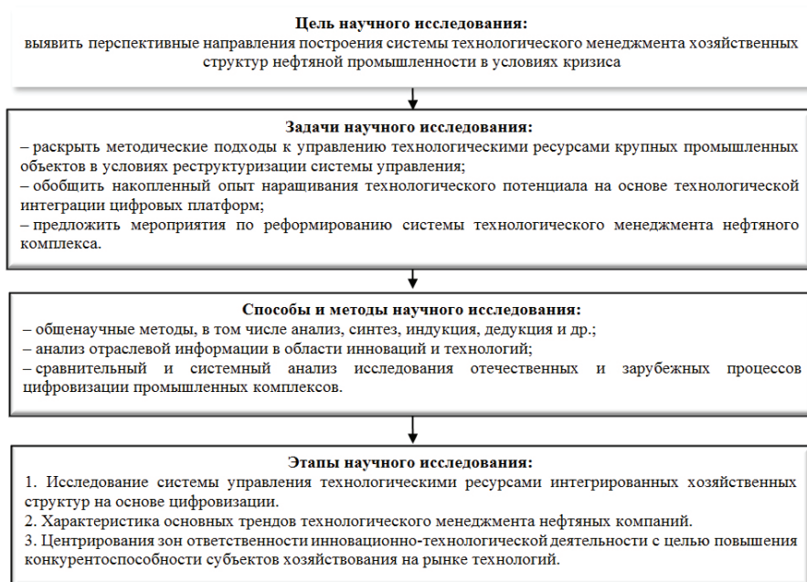
Рис. 1. Структурно-логическая схема научного исследования

Исследователи рассматривают предприятия в качестве слабоформализованных сложных систем, при этом акцент ставится на установлении