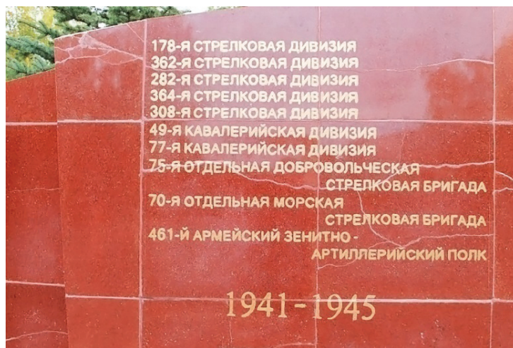
Рис. 1. Фрагмент мемориала в 14-м Военном городке